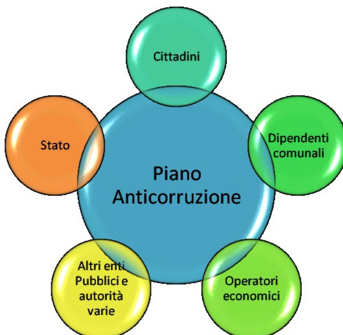
Figura 1- Piano anticorruzione comunale e portatori di interessi